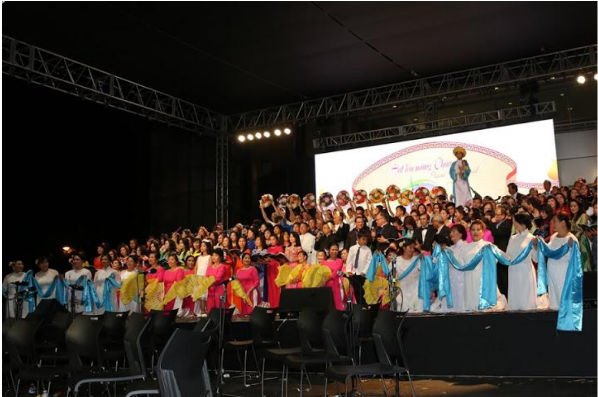
Chung Khúc Kinh Hòa Bình bế mạc Đại Nhạc Hội.