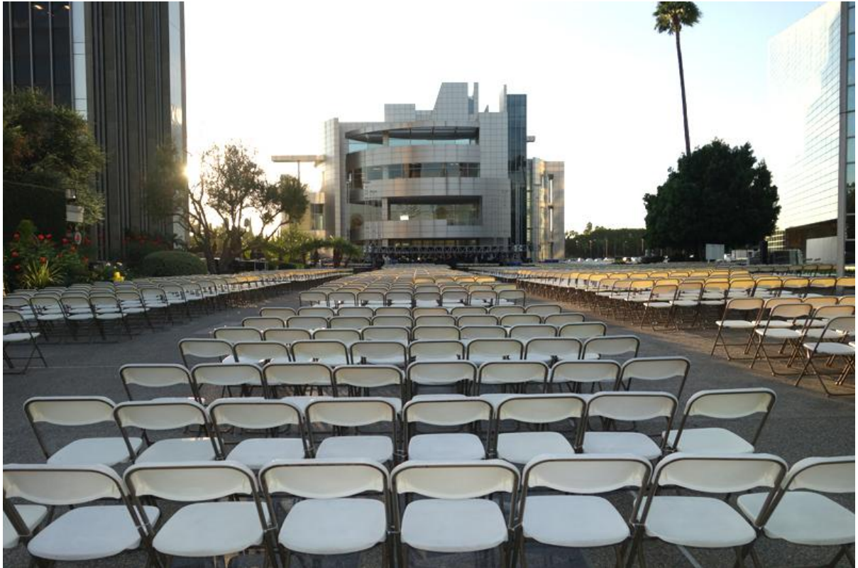
Gần 4000 ghế ngồi chuẩn bị cho Đại Nhạc Hội Hát Lên Mừng Chúa.