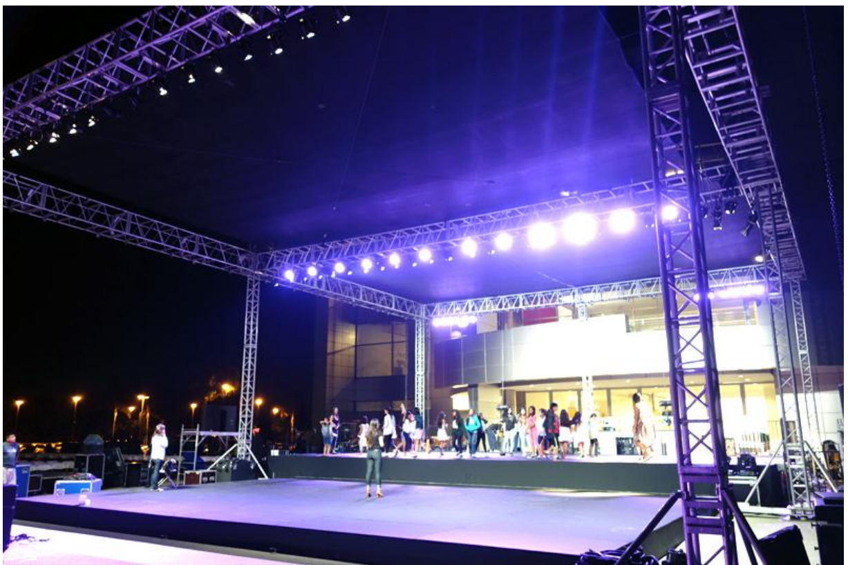
Sân khấu tối thứ 6 ngày 23.10.2015.