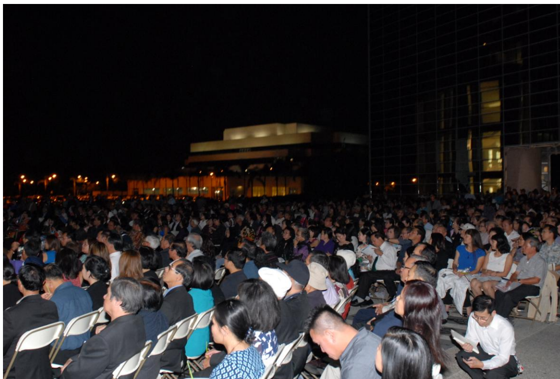
Khoảng 10,000 khán giả tham dự Đại Nhạc Hội.