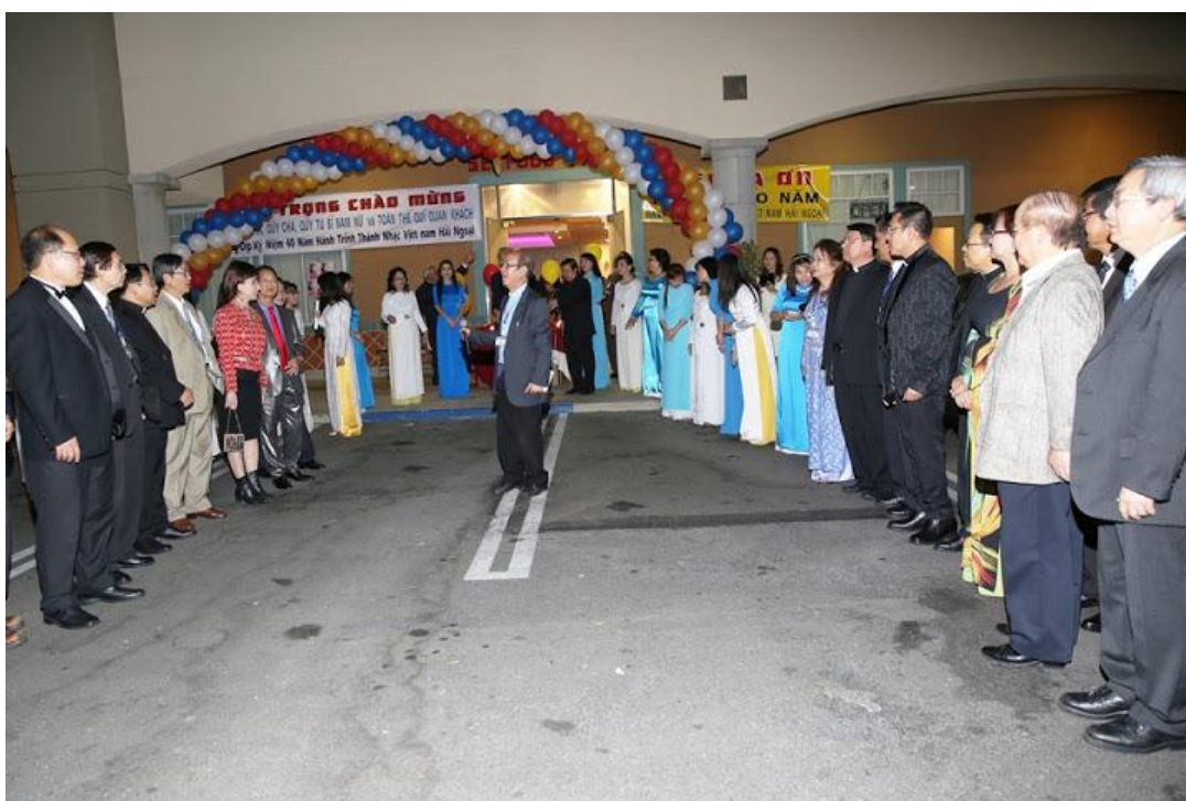
Chuẩn bị khai mạc Dạ Tiệc Tạ Ôn và Phát Hành Sách Thánh Ca và CD.