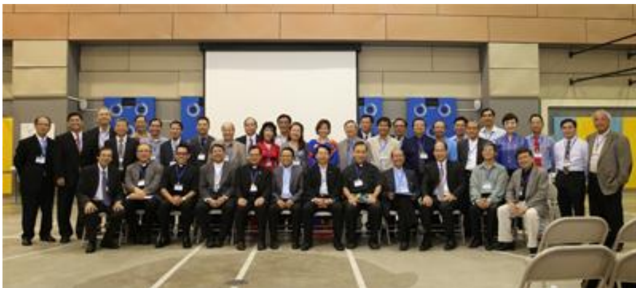
Quý Nhạc Sĩ từ muôn nơi về Hội Ngộ.

Sau 3 bài chia sẻ, Đại Hội Hát Lên Mừng Chúa đi vào phần thảo luận chung open forum. Đại Hội được chia thành 5 nhóm hội thảo với các câu hỏi thảo luận sau đó đúc kết.