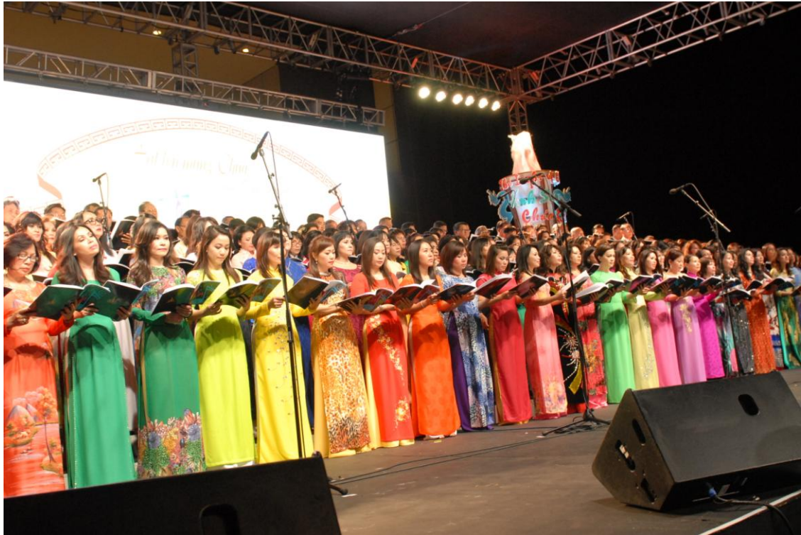
Liên Ca Đoàn Tổng Hợp Hát Lên Mừng Chúa.