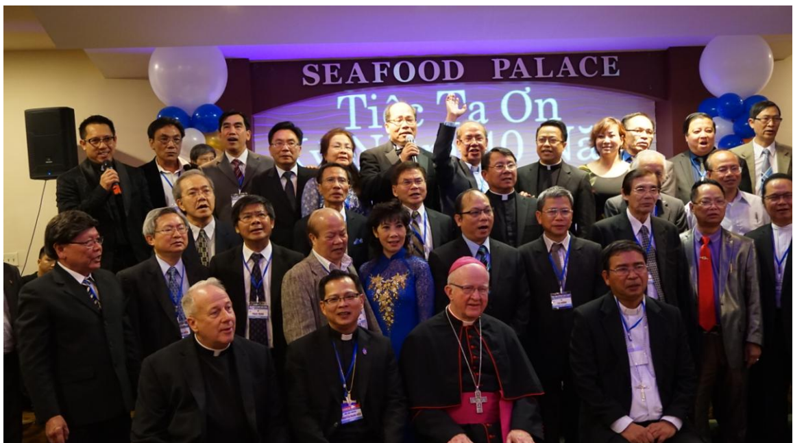
Cùng vang hát Kinh Hòa Bình với 800 ngọn nến tạ ơn.