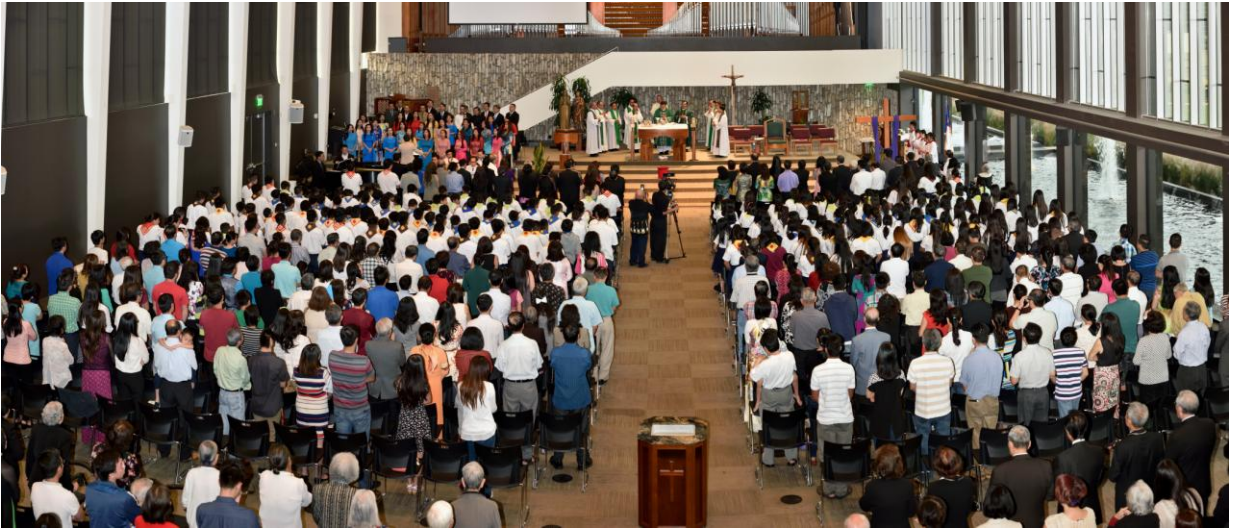
Quang Cảnh Thánh Lễ Tạ Ôn.