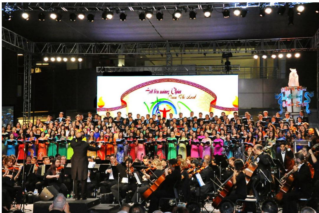
Đại Hợp Xướng Nữ Vương Hòa Bình theo Venetian Polychoral Style.