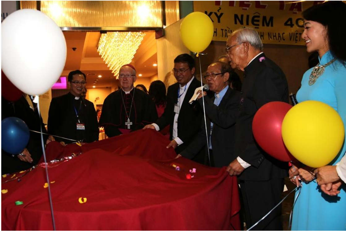
Nghi thức Phát Hành Sách Thánh Ca và CD Hát Lên Mừng Chúa.