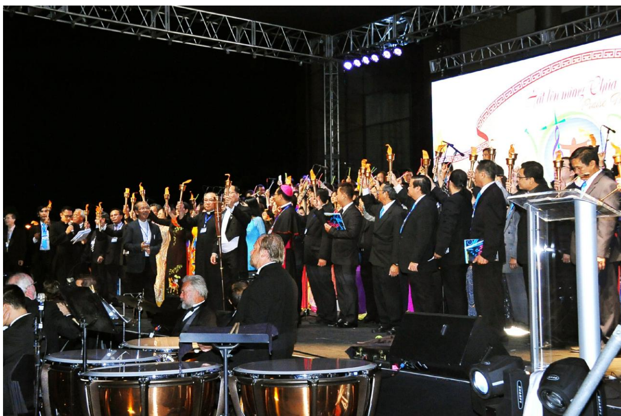
Rước Ánh Sáng Chúa Kitô với 80 ngọn đuốc Olympic.