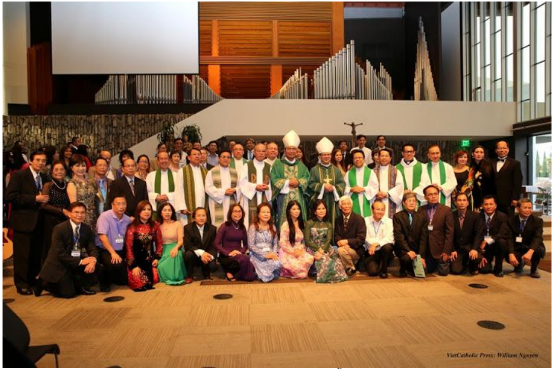
Photo lưu niệm sau Thánh Lễ Tạ Ơn.