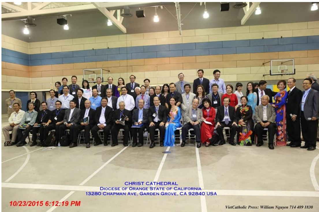
Đại Hội Hát Lên Mừng Chúa.

Tương nên nhắc lại "Đêm Nhạc Hội "Hát Lên Mừng Chúa" sẽ được tổ chức vào lúc 7:30 chiều thứ Bảy ngày 24 tháng 10 năm 2015 tại Nhà Thờ Chính Tòa Chúa Kitô, 13280 Chapman Ave, Garden Grove, California. Nhà Thờ Chánh Tòa Chúa Kitô Nhà Thờ Crystal Cathedral cũ, địa điểm này đã được biết đến khắp nơi trên thế giới vì những công trình kiến trúc đặc biệt nằm trong khu đất rộng 34 mẫu tây. Khu vực này có gần 2,000 chỗ đậu xe để khán giả không phải lo ngại về chỗ đậu.